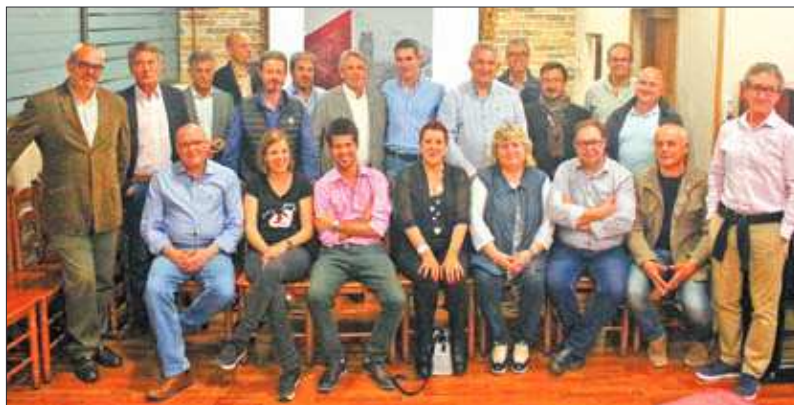
Els candidats de “Connectem Lleida” (Pimec) la nit de dimecres seguint la nit electoral