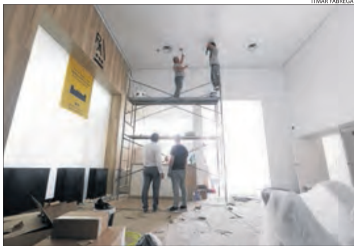
Operaris van portar a terme ahir els últims retocs.

Així mateix, l'hotel vol ser un aparador de productes de proximitat, que estaran a la venda com a souvenirs. Un exemple podria ser oli de les