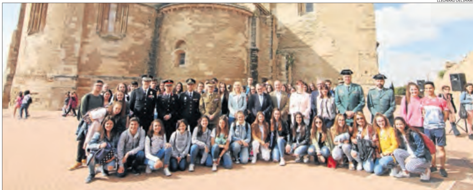
Les autoritats, al costat dels alumnes dels sis centres que van participar en el concurs per promoure el patrimoni cultural.

LLEIDA | La porta d'Europa al Baluard de la Reina, al Turó de la Seu Vella, va ser l'escenari escollit per celebrar l'acte institucional del Dia d'Europa, on alumnes de quart d'ESO i batxillerat van participar en un concurs audiovisual sobre el patrimoni de la ciutat, organitzat per la Paeria. L'institut Gili i Gaya va guanyar el premi, dotat amb 1.500 euros, i entrades per a esdeveniments culturals. El col·legi Claver va quedar segon.