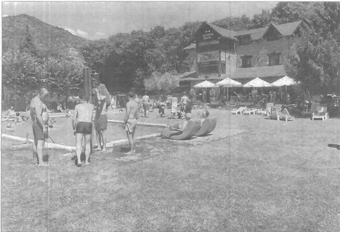
Imatge d'arxíu de turistes aquest estiu en un establiment hotelier de Sort.

La Federació d'Hostaleria de Lleida insisteix en l'import 'a la carta' segons el territori || Demana reunir-se amb la conselleria