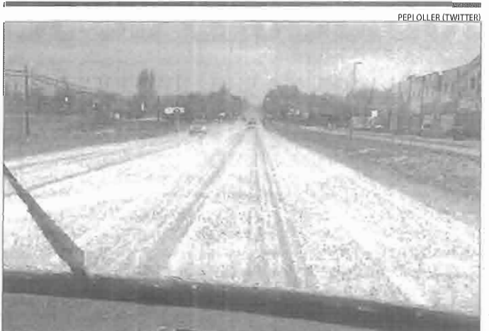
Pedra al Solsonès i tempestes a l'Alt Urgell ■ Una tempesta de pedra va caure ahir a la tarda entre Solsona i Olius (foto), i a la Seu d'Urgell es van acumular 24,4 litres, 20 dels quals en mitja hora, i 17 a Sort.

La Fira Ramadera de Barruera va aplegar ahir fins a seixanta parades, entre productors alimentaris de l'Alta Ribagorça i altres de comarques veïnes.