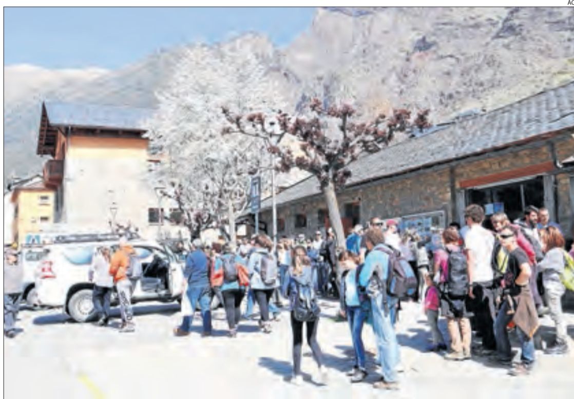
Turistes a la parada de taxis per anar fins al Parc Nacional durant la Setmana Santa de l'any passat.