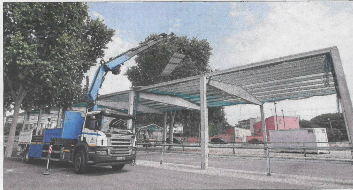
Un grup d'operaris instal·lant les noves cobertes al recinte firal dels Camps Elisis.

LLEIDA | L'ajuntament va treure ahir a licitació 20 finques municipals per un import total d'1.294.000 euros. A excepció d'una, que està ubicada al carrer Narcís Monturiol i valorada en 252.482,69 euros, les dinou finques restants corresponen a solars situats als carrers que conformaran la futura zona comercial de Torre Salses i estan valorades en 66.353,67 euros cada una.